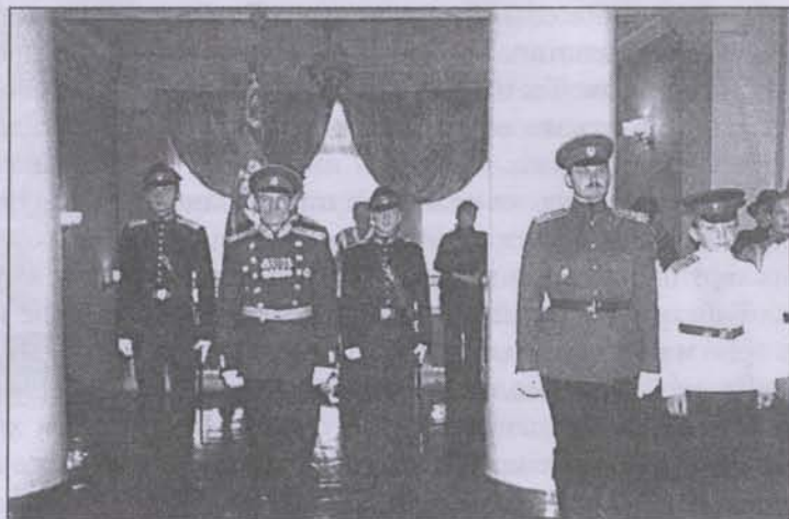
... и на построении в Воронеже

Когда мне сказали, что мы поедем в Воронежский кадетский корпус, я очень обрадовался.