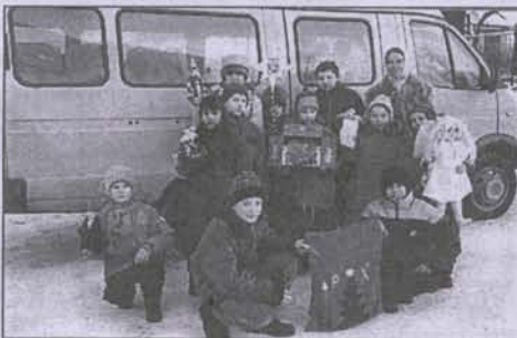
На автобусе и колядовать легче!

А утром, как следует выпавшись, отправились славить Христа.