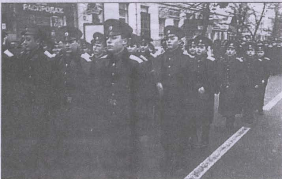
Воронежских кадетов не сосчитать...

знамени. Наконец была самая торжественная часть — церемония награждения, и концерт. Сначала читали стихи, потом был спектакль и торжественный бал. С кадетами мы ездили в