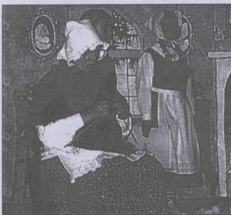
Бабушка, Кай и Герда... начало сказки

И даже — катание на лошадях в Новом Иерусалиме, без которого разве можно представить русское деревенское Рождество?