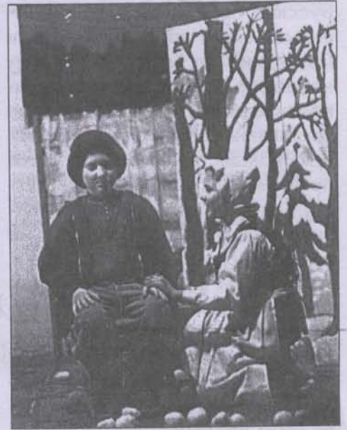
Кай еще ледяной, но скоро произойдет чудо...

праздник всякий раз становится Праздником.