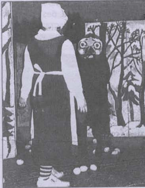
Встреча с вороном

А мы только начинаем играть в театр. Наши дети не умеют взрослому отгораживаться от стресса, они все переживают в полную меру. Однако, сквозь страх и неуверенность, спектакль был блестяще сыгран. Потому что существуют в этом мире, кроме собственной нашей внутренней тьмы, волнения, недостаточности сил, еще и крепость молитвы, уносящей всякие страхи, и тепло любви, и радость от дарения радости. Оттого и