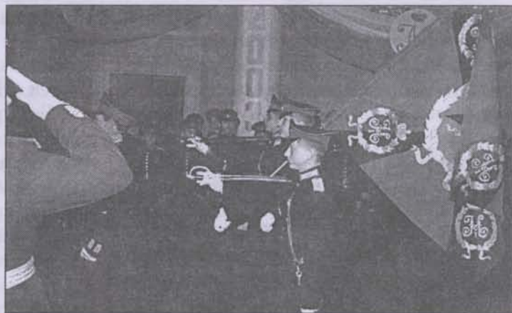
Торжественный вынос знамени Воронежского кадетского корпуса

всему, находясь впервые в настоящем корпусе. Наконец, скомандовали построение, прочитали молитву и пошли на трапезу. Так мы прожили первый день. Наступил второй день. В этот день у Воронежцев был корпусной праздник. Сначала была литургия. Потом молебен. И случилось неожиданное. Батюшка сказал, что в Воронеж привезли мо-