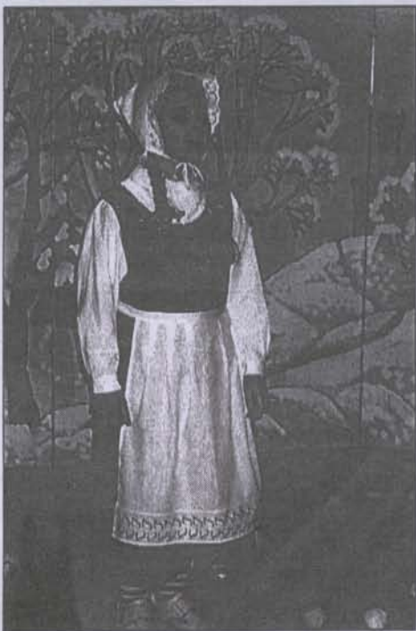
«Где искать названного братца?»

Наверное, трудно найти человека, который не любил бы сказки Андерсена, причем, совершенно неважно, сколько тому человеку лет. И оловянному солдатику, и Дюймовочке, и тем более, Каю и Герде отведено место на самых почетных полках нашего хранилища памяти. Нам кажется, что именно эти книжки легче всего подведут наших деток к пути добра и правды, помогут по нему следовать. И мы, как когда-то