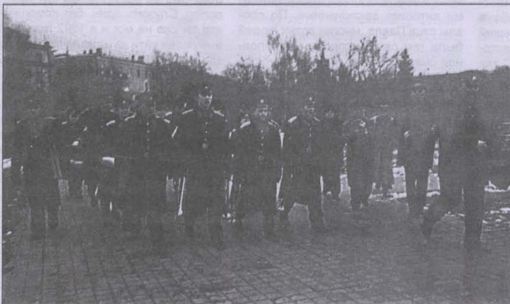
... у них даже свой оркестр есть

был очень красивый, пышный, веселый, необыкновенный он понравился всем. И я думал: быстрее бы у нас был корпус, тогда мы пригласили бы туда воронежских кадет и устроили не менее веселый и пышный концерт. Сначала была «звезда с церемоний». Это такая традиция, когда поется песня Дворянского полка и поминается память всех военнослужащих и кадет, шефа корпуса, поется песня