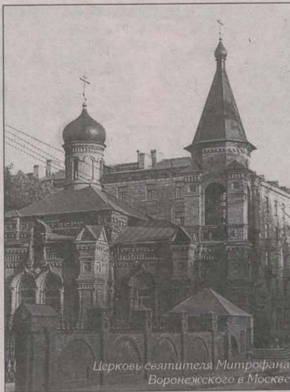
Церковь святителя Митрофана Воронежского в Москве