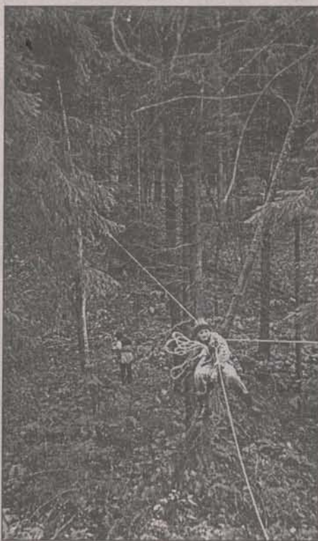
Канатная переправа — дело серьезное

то и гадостях. Генетическая память об инициациях, которым под-