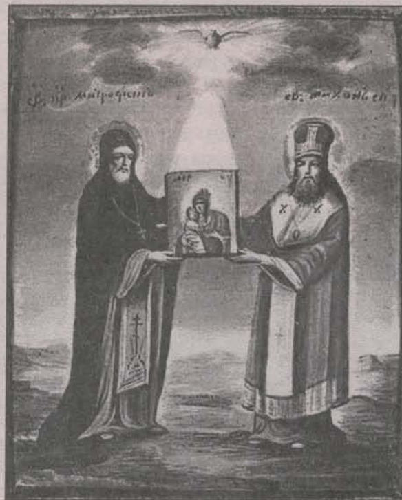
Святители Митрофан Воронежский и Тихон Задонский

Митрофан требовал от Петра снять с его воронежского дома помещенные там изображения языческих богов, и отказался идти к царю, пока эти изображения не будут сняты. Самовластный Петр пришел в ярость и угрожал святителю казнью. Святитель настаивал: «Лучше умереть, чем присутствием своим или боязливым молчанием одобрять язычество. Неприлично государю православному ставить болваны языческие и тем соблазнять простые сердца народа». Святитель стал готовиться к смерти и распорядился, чтобы благовестили в большой колокол ко всеобщей. Государь послал к архиерею спросить, отчего благовестят. Он ответил, что собирается напутствоваться к смерти. Поразила царя эта ревность святителя, он послал ус-