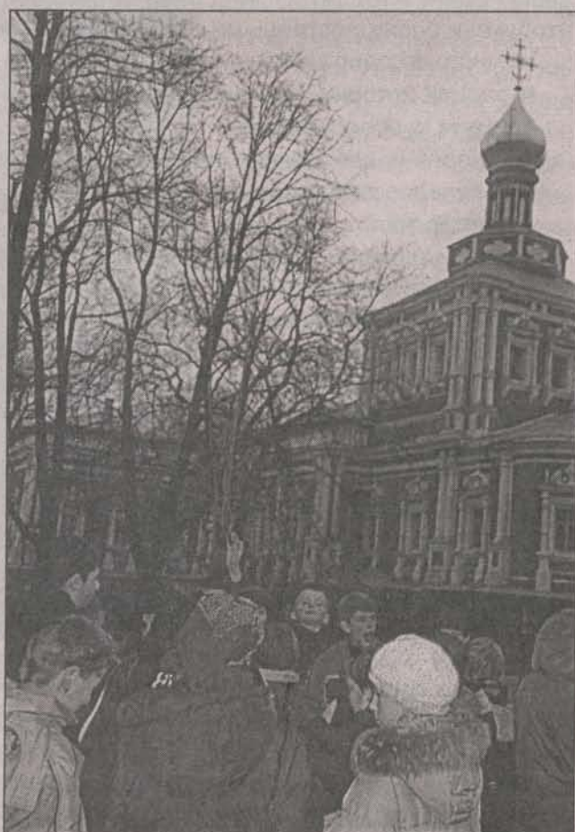
Встрашние разведчики в Новодевичьем монастыре

стков, использовав внешние атрибуты и принципы жизни военной разведки, дополнив их воспитанием по евангельским заповедям. В России это движение возникло практически сразу после его зарождения в Англии, пользовалось поддержкой Государя императора Николая Александровича. Известно, что цесаревич Алексей, будущий царственный мученик, тоже участвовал в подобных играх «потешных» (так первоначально назывались русские скауты). Это движение и сейчас