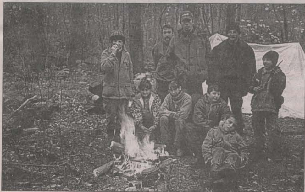
Взрослым и детям хорошо вместе

И обратную дорогу домой они тоже нашли сами, без нас, как бы привели взрослых за собой. Сперва шли по компасу, а потом, на дедовском поле, ориентировались по шпилью нашего храма, который издали виден. Так шли и шли к храму и вышли к дому. Да еще норовили забирать друг у друга рюкзаки, помогать отстающим. Словом, испытание окончилось счастливо и без неприятностей. И отроки наши приобрели новый, бесценный в их возрасте опыт. Благодаря Божьей помощи, собственным усилиям и молитвам, и поддержке взрослых, серьезных людей — спасателей.