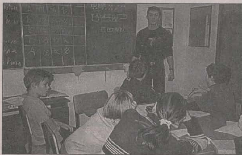
Занятие по шифровке команды «Кобра»

Вот и мы с нашими отроками решили сыграть в эту великую подростковую игру, полную радостей и опасностей. Они не называли себя скаутами, у них не было разноцветных форменных галстуков, знамен, построений и наградных нашивок на рубашках, обычных у скаутов, но было главное — испытания на прочность, дружбу, находчивость. И они справились с ними достойно, о чем свидетельствовали памятные дипломы.