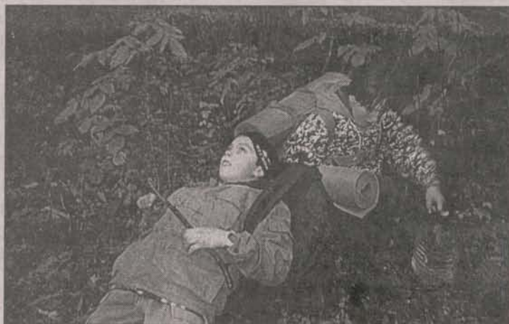
Мы уже так устали, а приключения еще не кончились!

К осеннему походу готовились серьезнее, чем обычно, в том числе, готовились и к сырому лесному холоду. И конечно, исправляли школьные