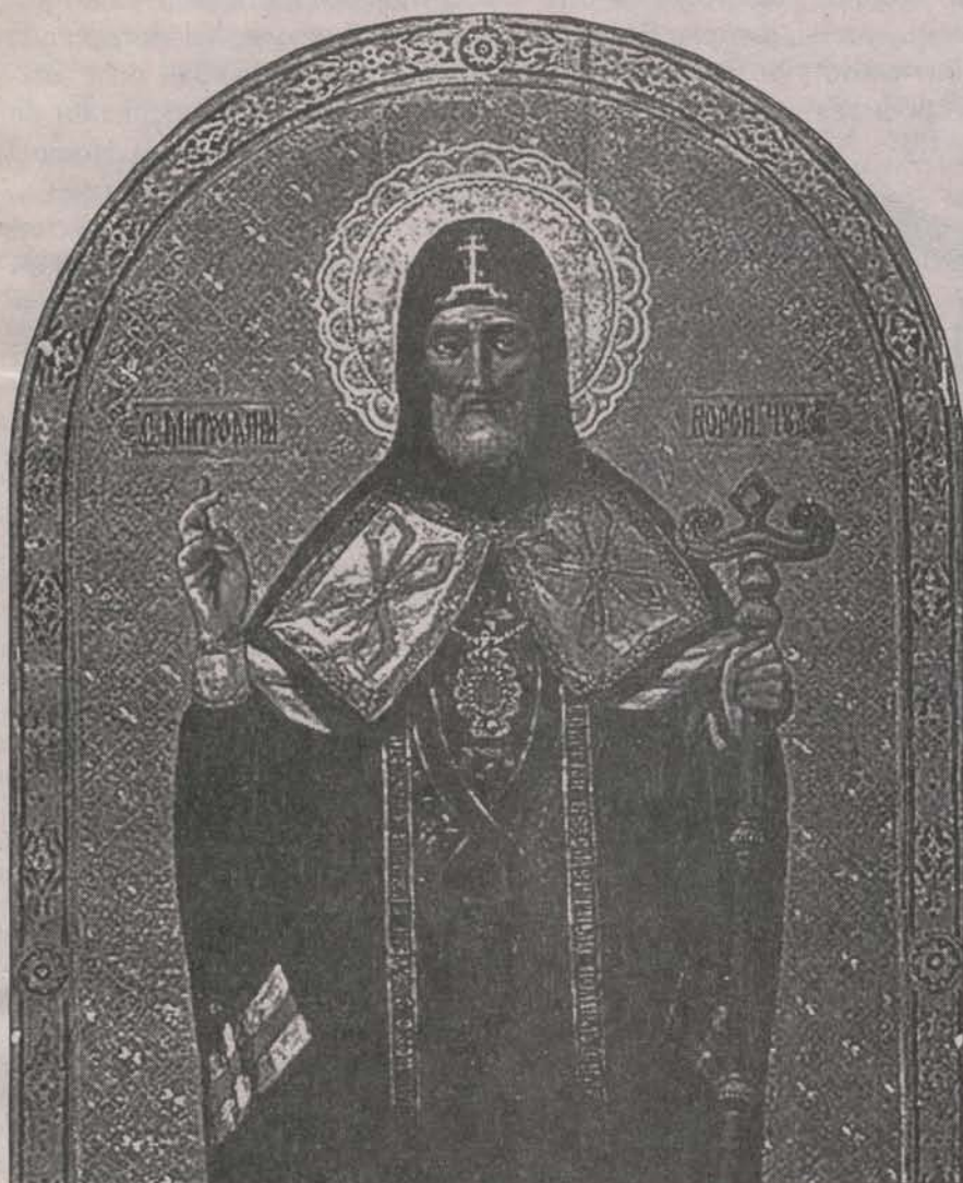
Икона святителя Митрофана Воронежского из храма, освященного в честь этого святого в Москве

Не бойся, малое стадо! ибо Отец ваш благоволил дать вам Царство. Лука 12, 32