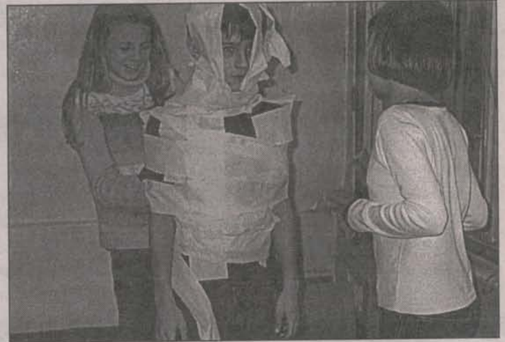
Конкурс на лучший маскировочный костюм

газеты «Одна семья» за 2003 год). Мы договорились встретиться снова осенью, на каникулах, только теперь в Москве.