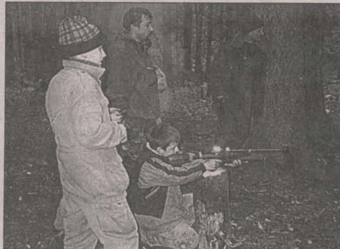
Умение метко стрелять юноше пригодится

ческие фигуры. Страшно очень, хочется удрать домой, но каждый помнит неудачу прошлой робинзонады, помнит, что никто не решился тогда отправиться в неизвестный маршрут. И теперь тихо молятся