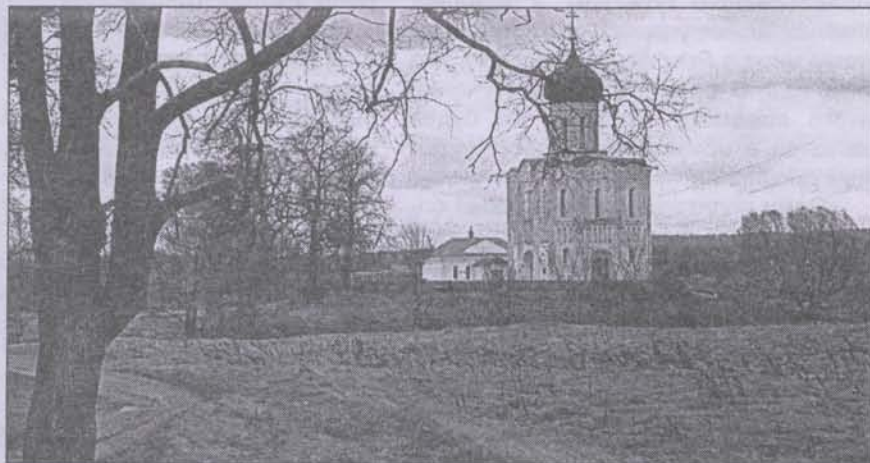
Церковь Покрова на Нерли. XII век.

Из школьного курса истории мы знаем, что Владимир был второй после Киева столицей Древней Руси. Помним про золотые ворота, которые встречают путе-