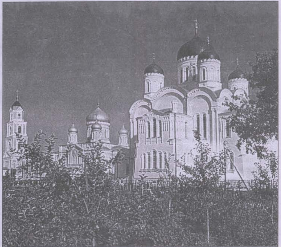
Свято-Троицкая Серафимо-Дивеевская обитель

Но вот ударил монастырский колокол, и на паперти Троицкого собора показалась тёмно-коричневая резная рака с мощами преподобного Серафима. Её несли священники в зелёных облачениях. Рака медленно проплыла по монастырю, нырнула в проём коло-