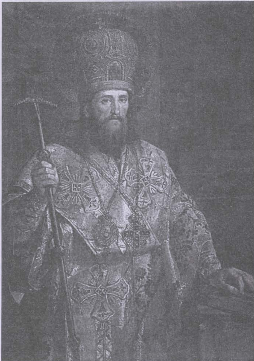
Святитель Димитрий Ростовский. Первая половина 1800-х годов. Художник В. К. Шебуев

Не бойся, малое стадо! ибо Отец ваш благоволил дать вам Царство. Лука 12, 32