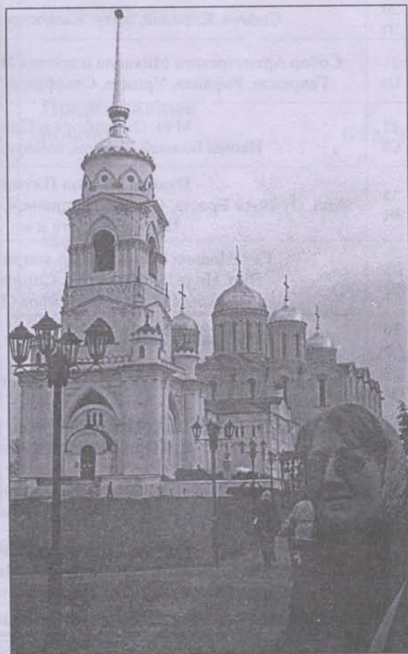
Успенский собор во Владимире