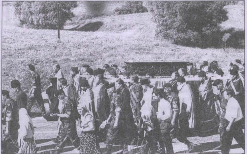
Крестный ход Дивеево — Саров

Я вышел на обочину дороги, чтобы посмотреть на участников шествия. Идут молодые и пожилые, идут мужчины и женщины, идут с иконами и свечами, идут с рюкзаками и лёгкими сумками. Идут инвалиды на костылях, не