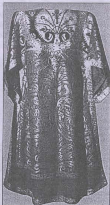
Саккос святителя Димитрия. Собрание Ростовского музея