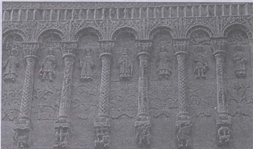
Белокаменная резьба Дмитриевского собора

Зрелым мужем он покинул Киевский Вышгород и уехал в эти места, к берегам тихой речки Клязьмы, в свой любимый город Владимир, основанный его дедом Владимиром Мономахом. Князь Андрей замыслил возвеличить этот город, укрепить его, сделать сильным и благолепным. Это было необходимо, чтобы расширить и укрепить русские земли на северо-востоке. А чтобы сопутствовал успех, князь Андрей взял с собой святую Богородичную икону, ставшую впоследствии известной как икона Владимирской Божией Матери.