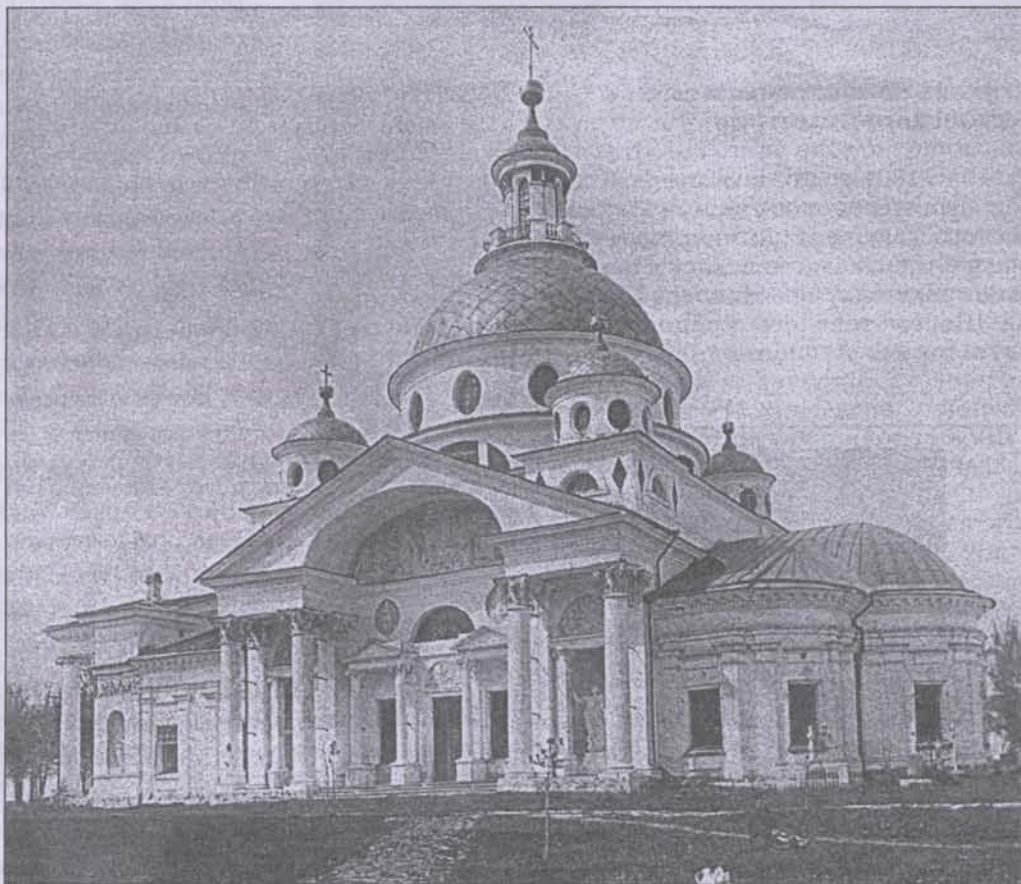
Церковь во имя свтителя Димитрия. Фото начала XX века

Через 43 года, в 1752 году, при святителе Арсении, митрополите Ярославском и Ростовском, были обретены мощи Святителя Димитрия. Во время ремонта был разобран пол и под