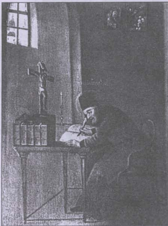
Святитель Димитрий Ростовский за составлением Житий святых. Картина неизвестного художника XVIII века. Собрание Ростовского музея

В 23 года он стал известным проповедником. Его проповеди со вниманием слушали в Чернигове, Вильне, Батури-не, Слуцке. Иеромонах Димитрий весь свой дар красноре-