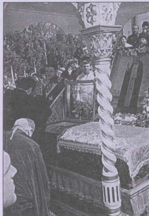
Ураки преподобного Серафима