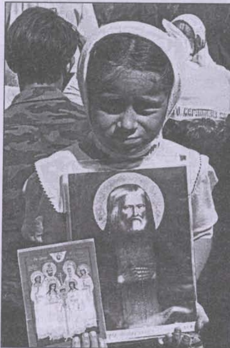
Юная паломница на дивеевских торжествах

В 1829 году батюшка велел опахать землю, на которой располагалась Мельничная община, сохою по одной борозде три раза и окопать её канавкою в три аршина ширины (два метра пятнадцать сантиметров). Вынимаемую зем-