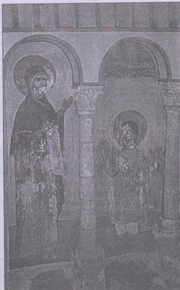
Боголюбская икона Пресвятой Богородицы. Фреска из палат св. кн. Андрея Боголюбского