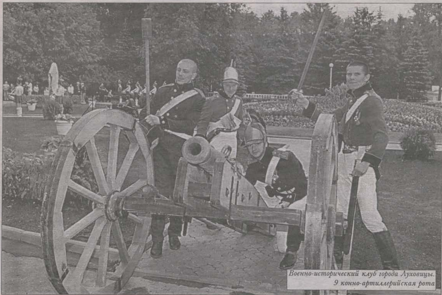
Военно-исторический клуб города Луховицы. 9 конно-артиллерийская рота

Бородино было самым страшным, небывалым «в летописях мира» (по слову самого Кутузова) побоищем вплоть до появления ядерного оружия. Свыше 300 тысяч человек насчитывали яростно сражавшиеся армии. Они бились 17 часов, от рассвета до ночи, на фронте протяженностью всего около 5 километров. Их потери в этот день превысили 92 тысячи человек.