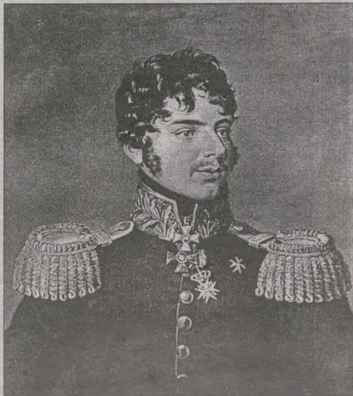
Граф Александр Иванович Кутайсов (1784-1812)