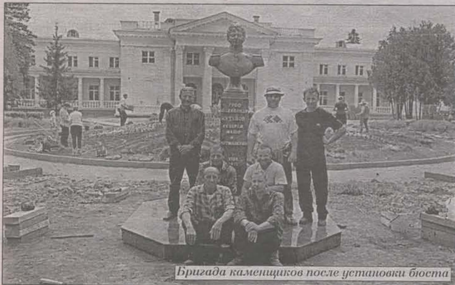
Бригада каменщиков после установки бюста