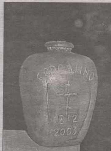
Капсула с землей с батареи Ржевского, захороненная в основании памятника