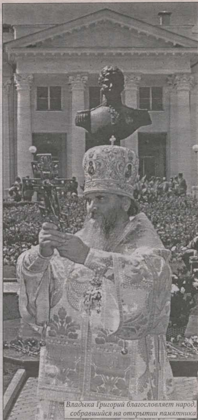
Владыка Григорий благословляет народ, собравшийся на открытии памятника