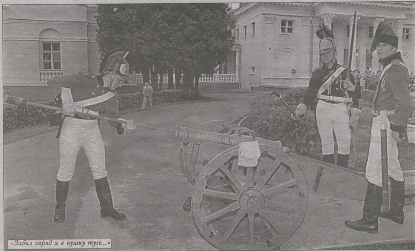
«Забил заряд я в пушку туго...»

А ты, Кутайсов, вождь молодой Где прелести? Где младость? Увы! он видом и душой Прекрасен был как радость; В броне ли, грозный, выступал - Бросали смерть перуны; Во струны ль арфы ударял - Одушевлялись струны О горе! Верный конь бежит Окровавлен из боя; На нем его разбитый щит И нет на нем героя.