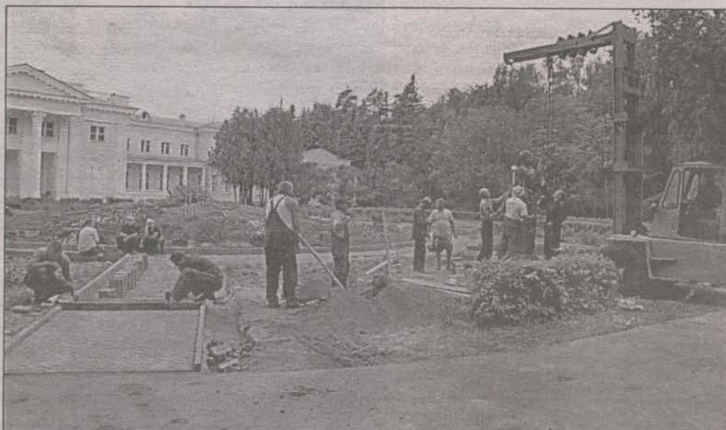
Работа над памятником