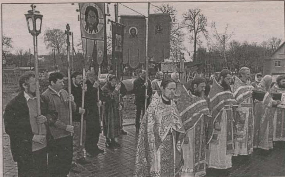
Крестный ход после службы

30 апреля в нашем храме состоялась соборное служение истринского духовенства.