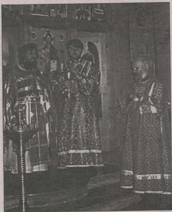
Вынос чаши и причастие