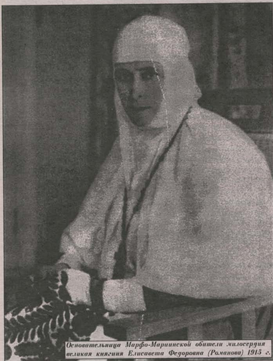
Основательница Марфо-Мариинской обители милосердия великая княгиня Елисавета Федоровна (Романова) 1915 г.