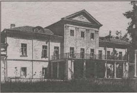
Усадебный дом со стороны парка

Уже в конце того же века имение переходит дворянам Голохвастовым.