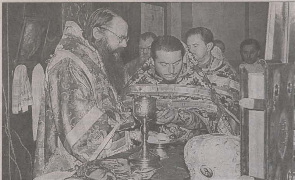
Архиепископ Можайский Леонид служит литургию в Троицком храме 22 ноября 1962 года на день памяти иконы Богородицы «Скоропослушница».