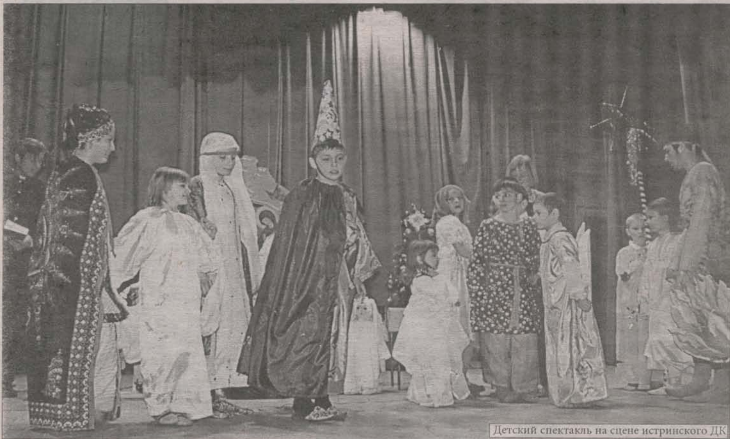
Детский спектакль на сцене истринского ДК

Но, неспроста каждому из нас предложено пройти длинным, а не коротким путем к Празднику, не зря столько дней приходится ждать. Наверное, именно столько времени нужно, чтобы душа все-таки настроилась, как скрипичная струна, и пела чистым звуком, а не дребезжала. Вот, кажется, все рухнет, ничего у нас со спектаклем не выйдет, разбежались именно те актеры, на которых была большая надежда. Может быть, очень по-