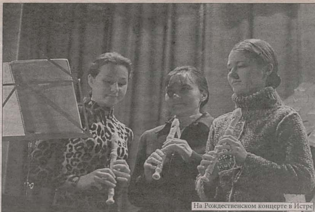
На Рождественском концерте в Истре

А утром седьмого января началась новая жизнь, в которой все наши неурядицы казались вообще несусвет-