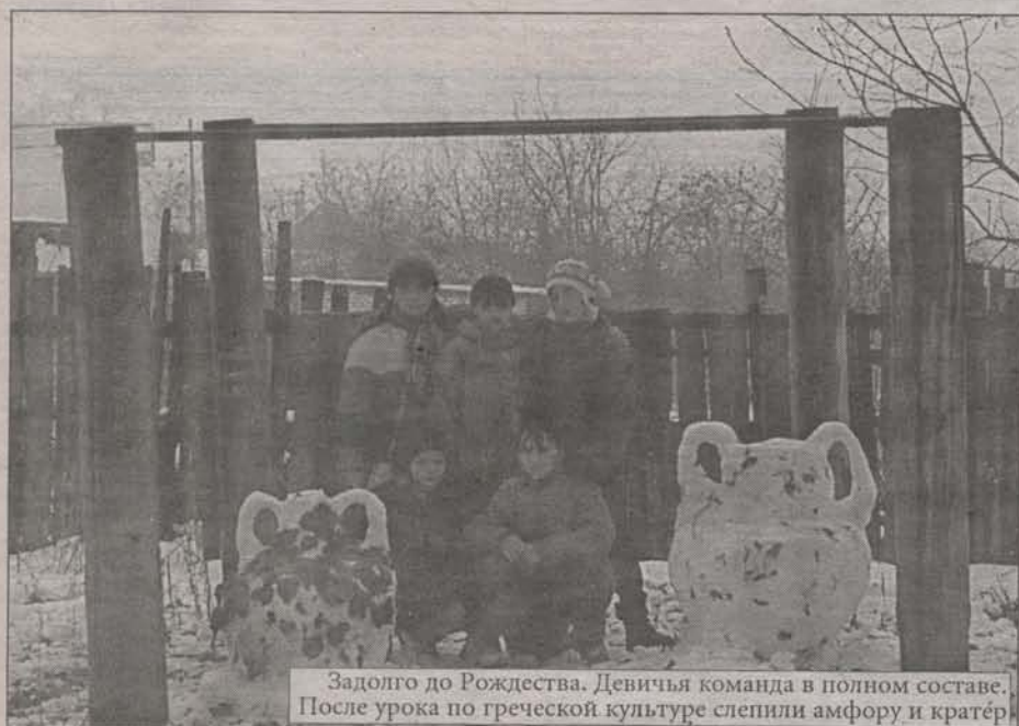
Задолго до Рождества. Девичья команда в полном составе. После урока по греческой культуре слепили амфору и кратер

Из Рождествено отправились пешком по морозу в Снегири, поздравлять наших малышей-первоклассников. Тут-то