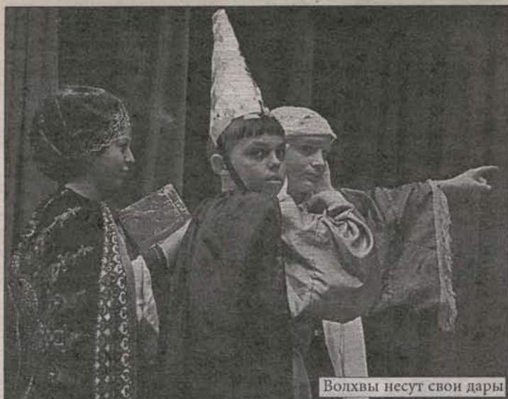
Волхвы несут свои дары