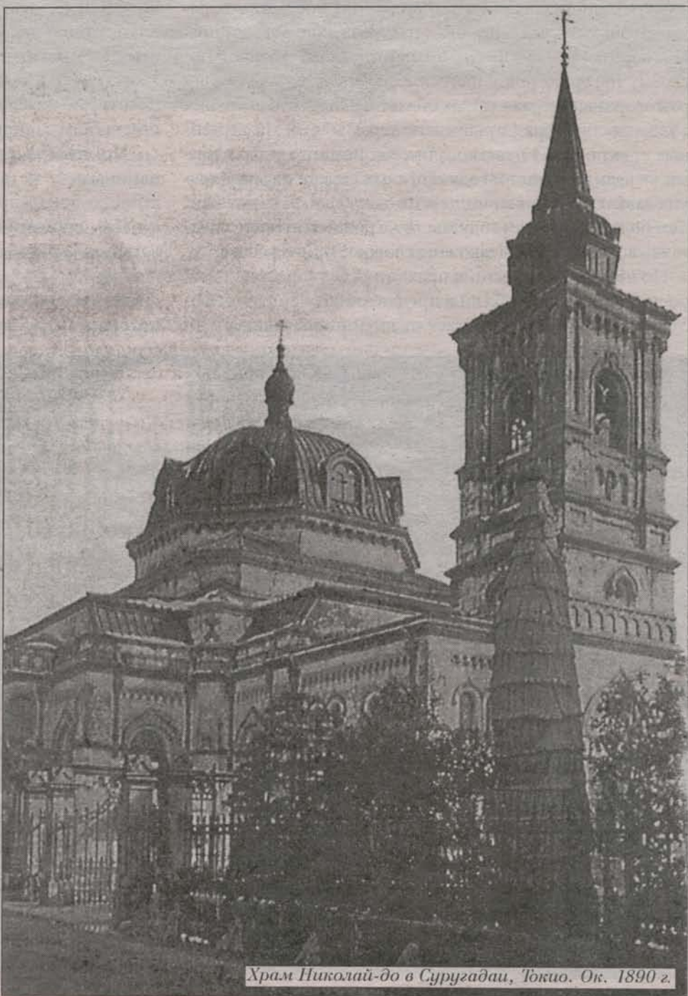
Храм Николай-до в Суругадаи, Токио. Ок. 1890 г.