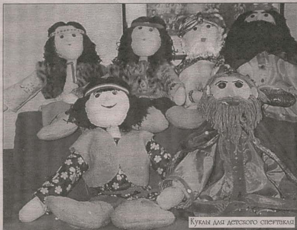
Куклы для детского спектакля

Спасибо девушкам — Люде, Лне, Дарье, что подарили нам эти радостные минутки в жизни.