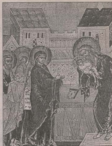
Сретение Господне XVII век.

Прокимен перед паремиями возглашается при открытых Царских вратах в знак того, что открывается некая тайна. Молящиеся приготовляются услышать откровение горнего мира дольнему. В Ветхом завете эти откровения предсказывали те