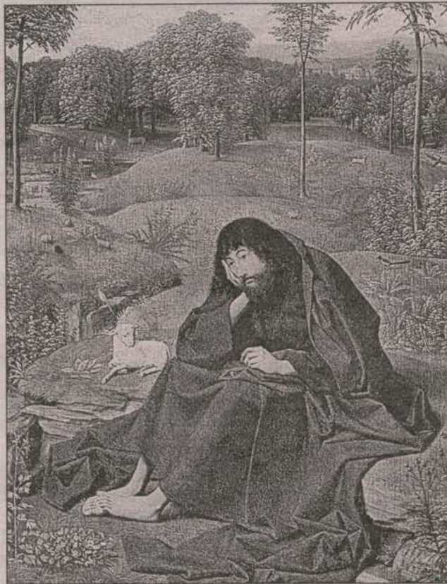
Св. Иоанн Креститель в пустыне. Гертгент тот Синт — Янс. XV век. Св. Иоанн изображен в глубоком раздумьи о судьбах человеческого рода и об Агнце Божьем, который изображен символически мирно пасущимся в уединении.

Путники нашли прибежище в пещере, куда пастухи загоняли скот во время стужи и непогоды. Иосиф, оставив Марию одну, отправился в дом Саломии, чтобы привести ее. В полночь в пастушечьей пещере произошло неведомое миру событие, которое изменило и определило всю историю мира — Рождество Иисуса Христа. Иудейский народ жил надеждами на исполнение пророчеств, ожидал пришествия Мессии больше, чем гипербореи — жители северных земель — ожидают восхода весеннего солнца над горизонтом после полугодовой зимней ночи. О Мессии звучали проповеди в храме. О нем рассуждали иудейские старцы в