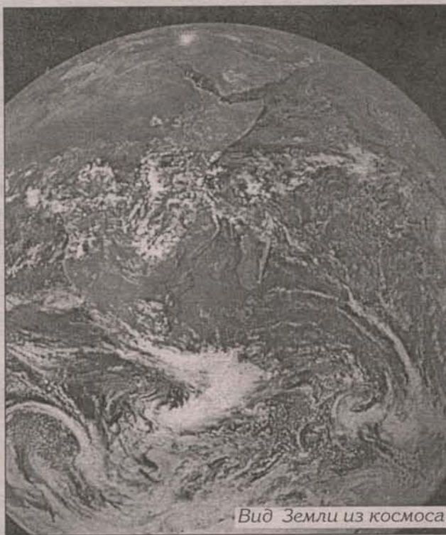
Вид Земли из космоса

Пока священник кадит весь храм мы умом пробегаем первые шесть «дней» творения, за которые были сотворены светило, планеты, устроена земля с живностью своей и из земли был создан «глаголивый сей», т.е. венец творения — человек. Человек был создан, чтобы возделывать землю, т.е. трудиться на ней. И, в первую очередь, это не копание лопатой (которое до грехопадения и не было нужным, все росло «само»), а именно молитва. Поэтому после затворения Царских врат (что символизирует возбранение Адаму входа в потерянный Рай) звучит Мирная ектенья: «Миром (т.е. в мире души и всем миром) Господу помолимся». Мирная ектенья включает в себя все прошения наши ко Господу и о Патриархе, и о духовенстве, и об отечестве, и о нас самих со всеми нашими нуждами. В силу такой всеох-