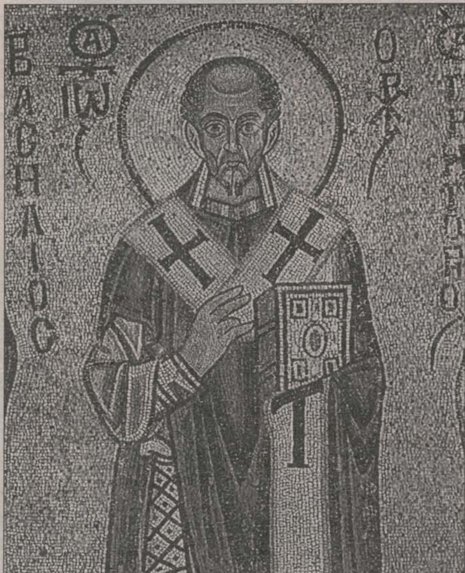
Иоанн Златоуст. Мозаика Софийского храма в Киеве