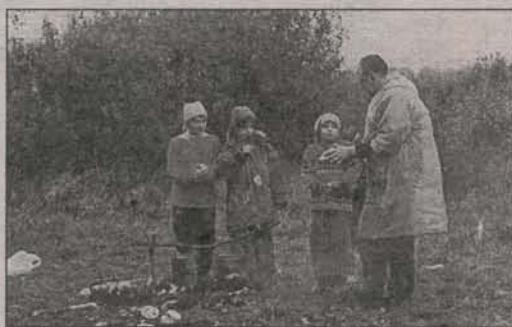
Хороша походная жизнь! И каша, сваренная на костре, — самая вкусная!