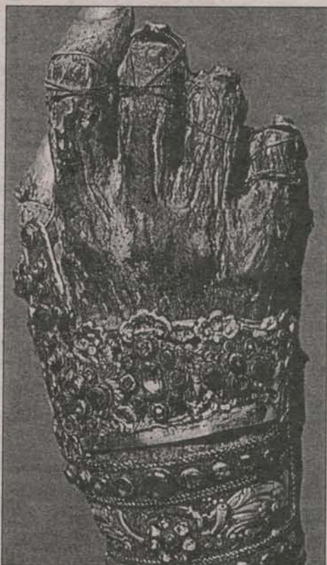
Десница св. Иоанна Златоуста, хранящаяся в Филофеевском монастыре на Афоне, пальцы святителя сложены в троеперсном крестном знамении