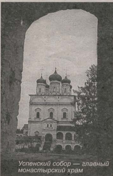
Успенский собор — главный монастырский храм