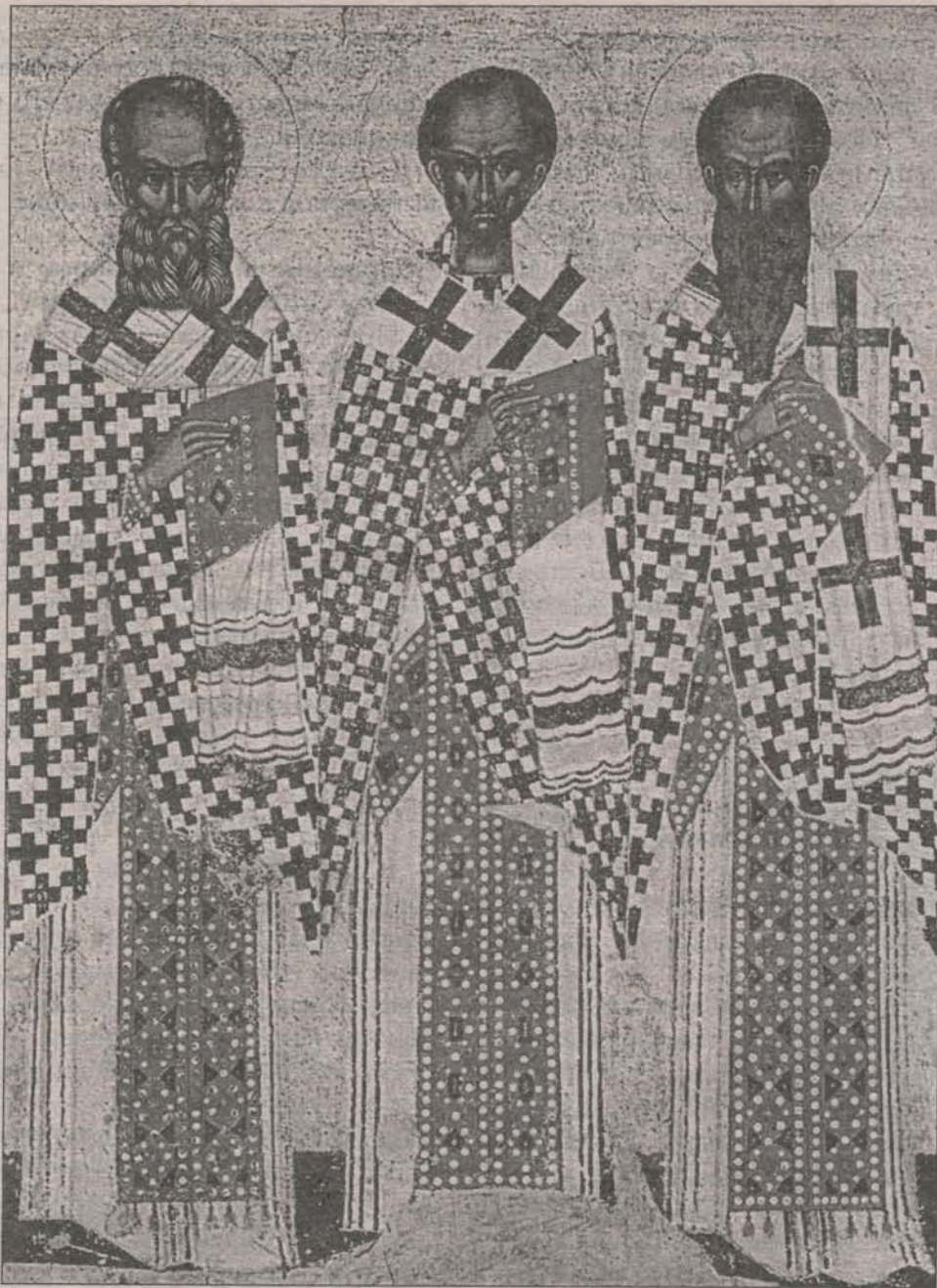
Икона трех святителей: Василия Великого, Иоанна Златоуста и Григория Богослова. Три святителя Церкви в разное время учились в одной школе у ритора Ливания

такая благодать, что слушатели не могли насытиться его беседами. Поэтому явились в церковь скорописцы, которые записывали за ним, а записи передавали или продавали всем желающим, которых было немало.