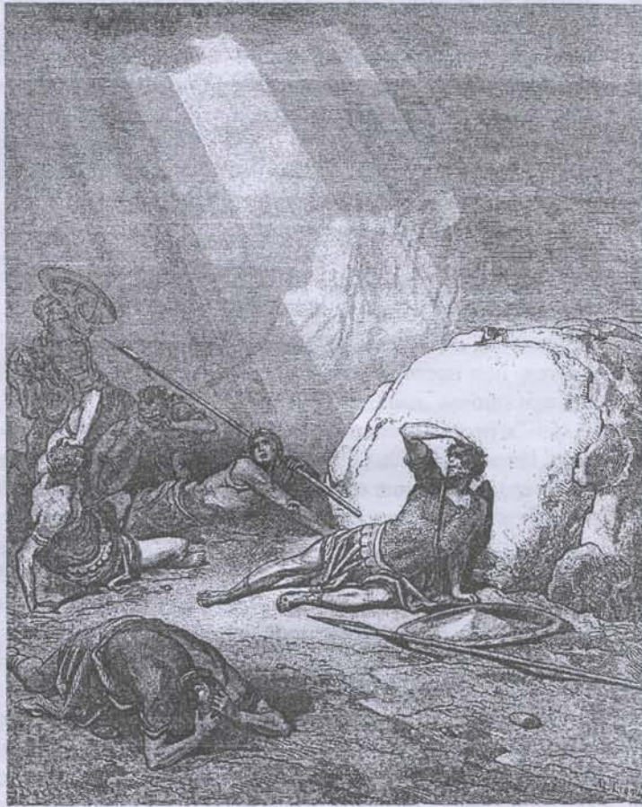
Савл на пути в Дамаск.

Петров день — и праздник рыбаков, поскольку апостол Петр был рыбаком и повсеместно известен как покровитель рыбного промысла.