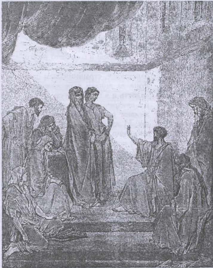
Апостол Петр в доме Корнилия.

Апостолов первопрестольницы, и вселенныя учителяе, Владыку всех молите, мир вселенной даровати, и душам нашим велию милость.