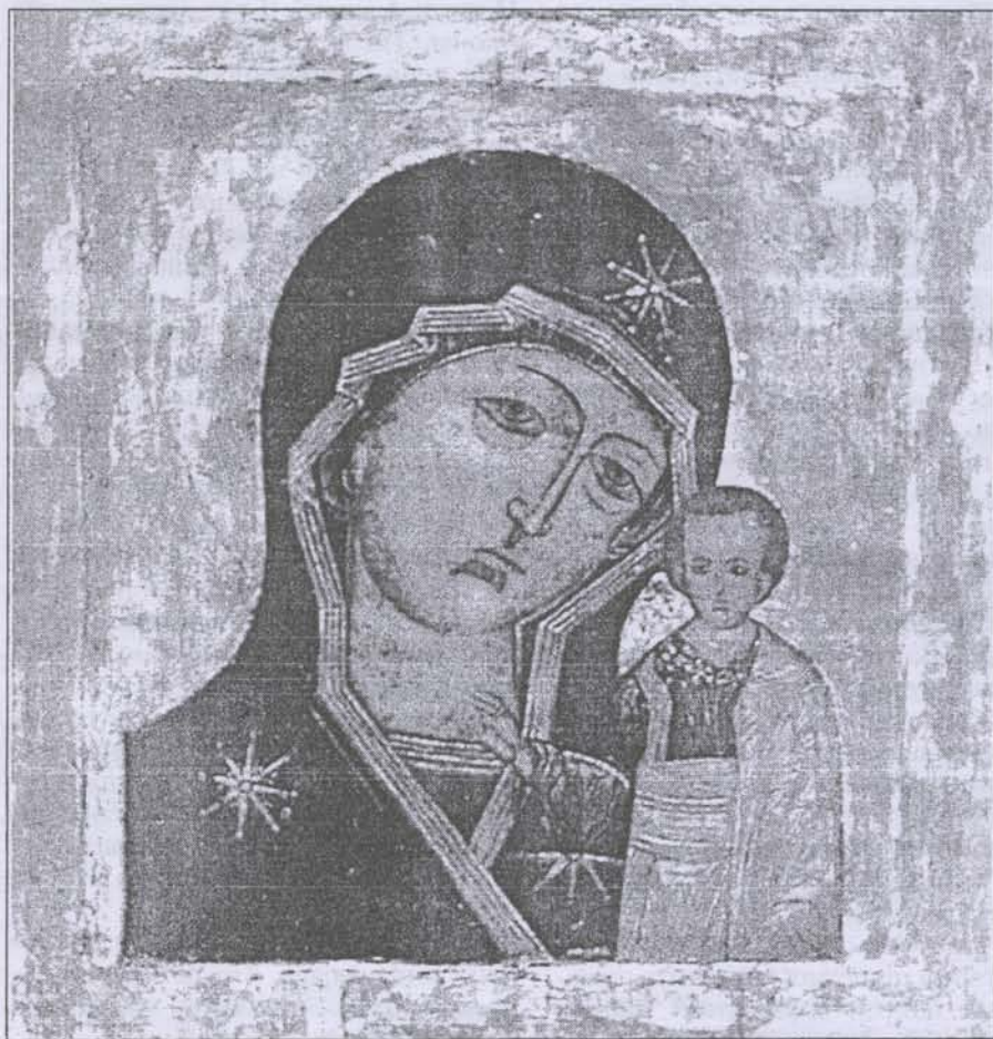
Тропарь Казанской иконе Божией Матери

Заступнице усердная, Мати Господа Вышнего, за всех молиши Сына Твоего Христа Бога нашего, и всем твориши спастися, в державный Твой покров прибегающим. Всех нас заступи, о, Госпоже, Царице и Владычице, иже в напастех и скорбех, и в болезнях обремененных грехи многими, предстоящих и молящихся Тебе умиленною душою, и сокрушенным сердцем, пред пречистым Твоим образом со слезами, и невозвратно надежду имущих на Тя, избавления всех зол, всем полезная даруй, и вся спаси, Богородице Дево: Ты бо еси Божественных Покров рабам Твоим.