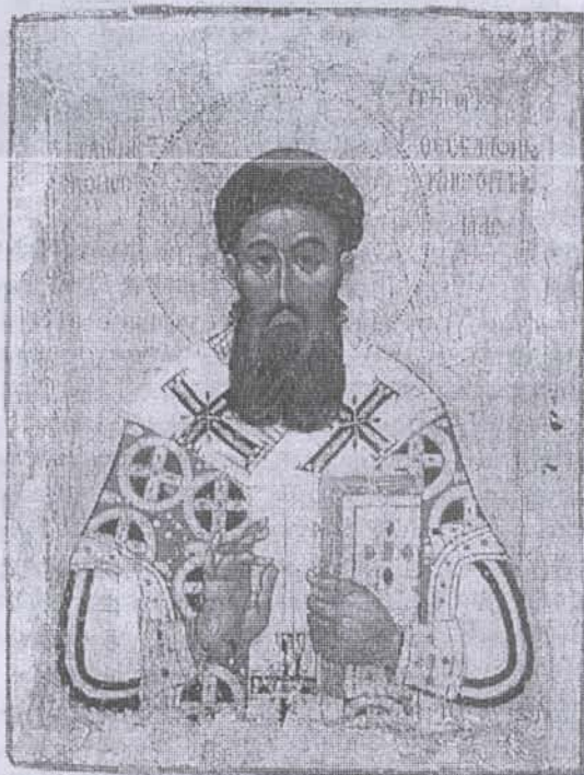
Святитель Григорий Палама

В середине следующей за этой неделей, пятой, совершается особо умиленная и древняя по своей форме служба в четверг 5 апреля (18 апреля). На утреннем богослужении прочитывается весь великий канон св. Андрея Критского (читанный по частям в первые четыре дня первой седмицы). Читается житие праведной Марии Египетской. По этим особенностям Богослужение четверга называется Андреевским стоянием и стоянием Марии Египетской. В каноне собраны и изложены все побуждения к посту и покаянию и св. Церковь повторяет его теперь в полном составе, чтобы вдохнуть в нас новые силы к успешному окончанию поста. Житие праведной Марии Египетской также «умиление предлагает бесчисленное и прегрешившим утешение дает многое», представляя собой нам и образец истинного покаяния и пример неизреченного милосердия Божия. Порядок этого богослужения уста-