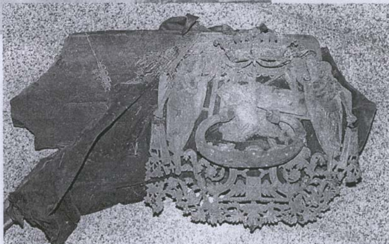
Фрагмент гроба с ручкой