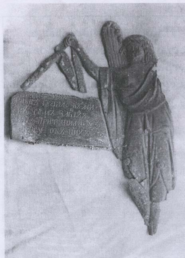
«Или не стало в мире сем злых, иль притупила косу об них?». Одна из погребальных эпитафий, риторический вопрос к смерти.