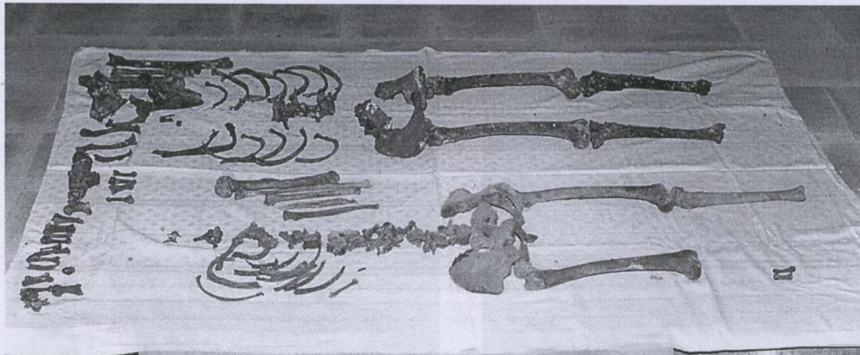
Костные останки, извлеченные из старого склепа