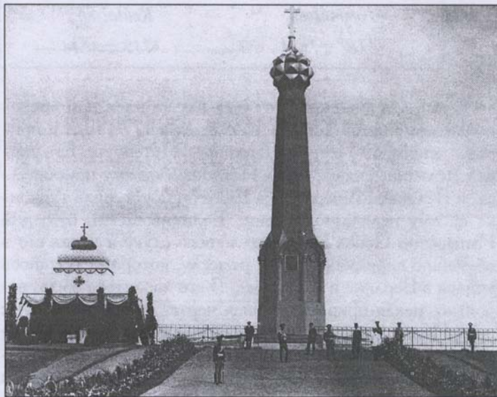
Храм-палатка императора Александра I и памятник герою Бородине на батарее Раевского. 1912 г.

Сегодня нам с вами, православным русским людям, выпала великая честь погребать останки основателей и строителей сего Храма, выдающихся людей России, в Бозе почивших более полутора столетия назад. Промыслом Божиим дано нам в этом возрождаемом из руин церковном здании свидетельствовать перед миром, перед