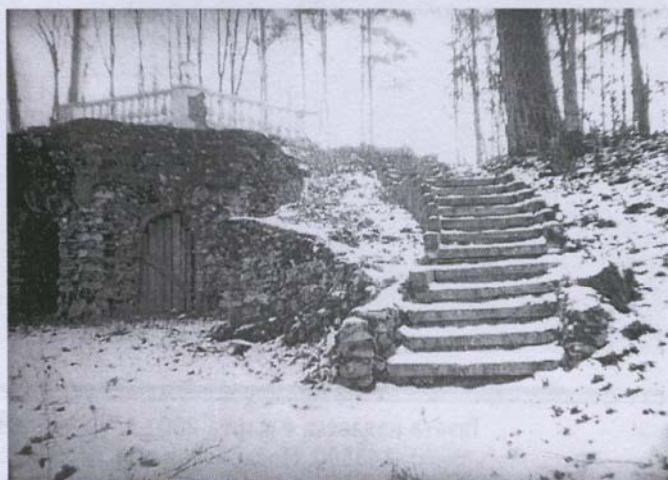
Грот в усадьбе Рождествено-Кутайсовых