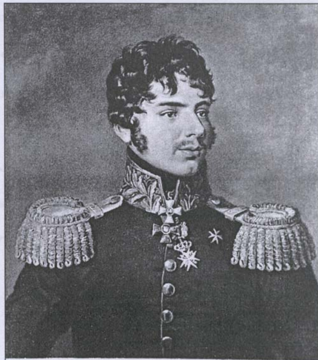
Исц. Г. Даву Peint par G. Davu Графъ Александръ Ивановичъ Le Comte Alexandre Ivanowitch Кутайсовъ, Koutaïssoff, 1784—1812 1784—1812

Накануне сражения начальник артиллерии русской императорской армии граф Александр Иванович Кутайсов написал своего рода инструкцию для своих подчиненных, простые слова которой «...артиллерия жертвует собой...» многоговорящи. В них отразилось высокое осознание сути христианского воинского долга, духовный