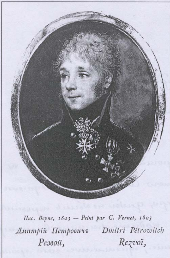
Исц. Верне, 1803 — Peint par C. Vernet, 1803 Дмнтрій Петровиць Dmitri Pétrowitch Резвой, Rezwoï,

Здесь, в селе Рождествено, и в этом храме бывал брат графини Анны Петровны, выдающийся военачальник, сподвижник Суворова и Кутузова, артиллерии генерал-майор Дмитрий Петрович Резвой, участник многих сражений, покрытый ранами и наградами георгиевский кавалер. Именно ему последовал в выборе своего жизненного пути, столь же славного, сколь и краткого, младший сын храмоздателей, граф Александр Иванович Кутайсов.