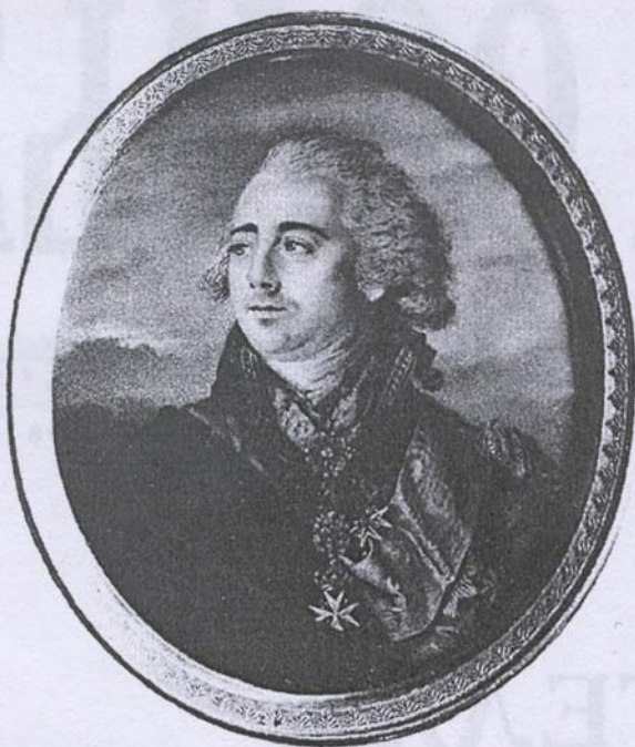
Графъ Иванъ Павловичъ Le Comte Ivan Pavlowitch Кутайсовъ, Koutaisoff, 1759 — 1834 1759 — 1834