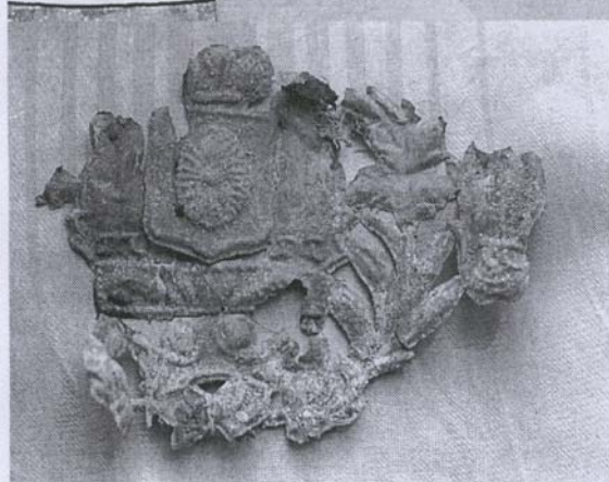
Фрагмент украшений гроба